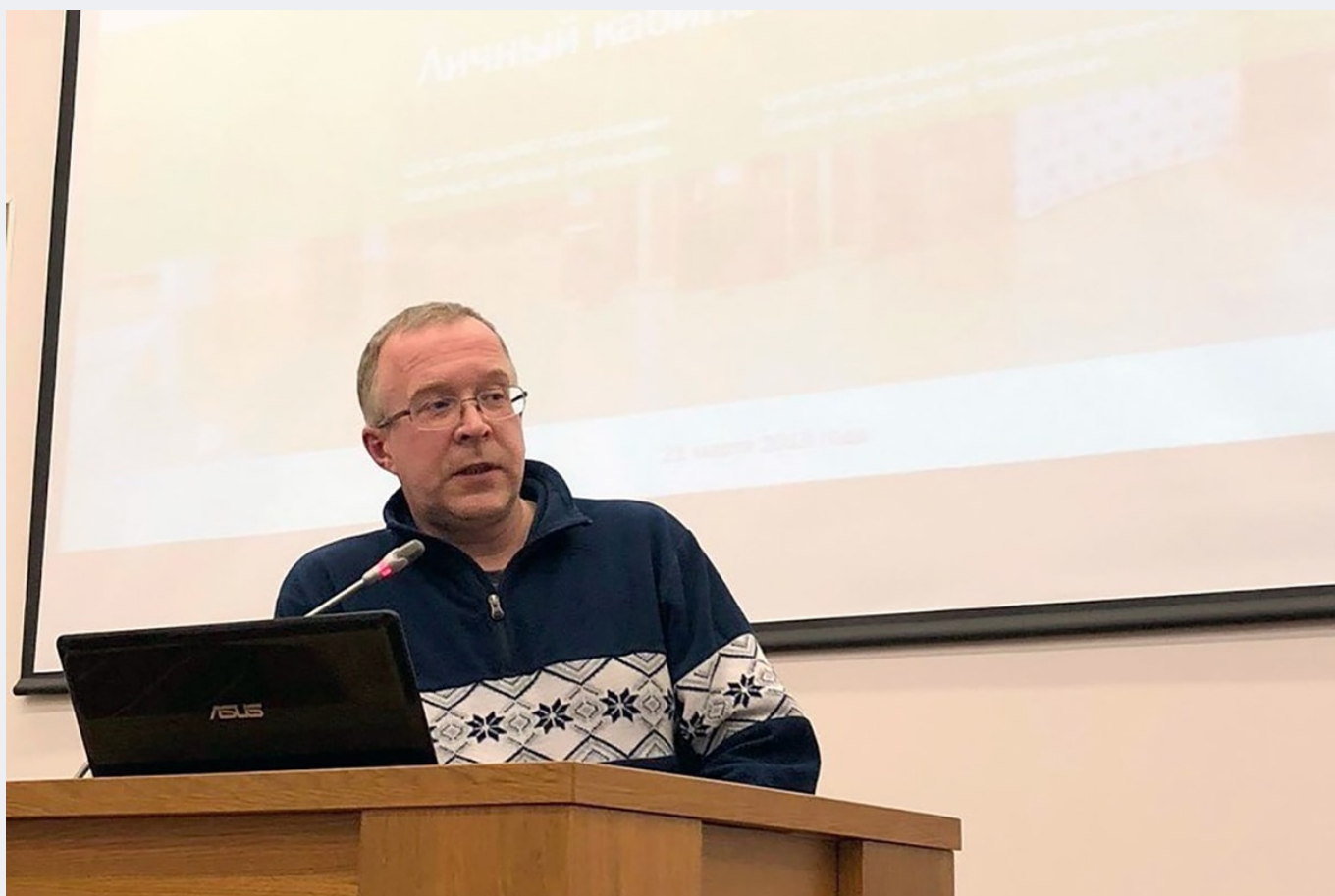
Основные вопросы УМС были посвящены подготовке к процедуре прохождения государственной аккредитации образовательных программ СПбПУ.