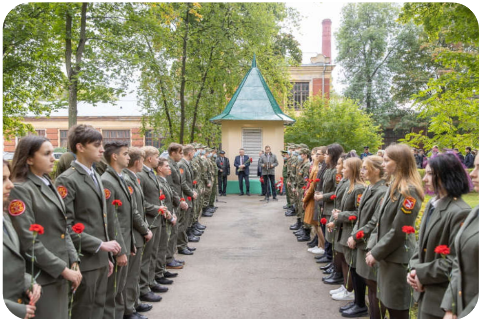
Митинг в День памяти жертв блокады 8 сентября

В преддверии годовщины Великой Отечественной войны в Политехническом состоялся митинг